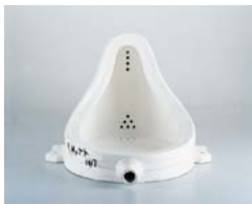
Marcel Duchamp “Fonte”, 1917 - edição réplica 1964 Readymade assistido: urinol de porcelana invertido, 61 x 48 x 36 cm

Custo: 5 euros (descontos vários) | Saber mais aqui